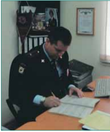
Начало на стр. 1.

– За последние годы все большее внимание в столице уделяется мерам по обеспечению безопасности граждан, охране жизни и здоровья москвичей и гостей города. Одной из форм реализации поставленных мэром и Правительством Москвы задач в этой сфере является вовлечение граждан в работу на общественных пунктах охраны порядка (ОПОП).