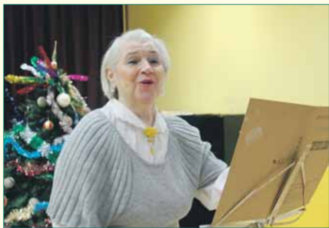
25 января в Центре «Орион» прошел вечер русского романса.