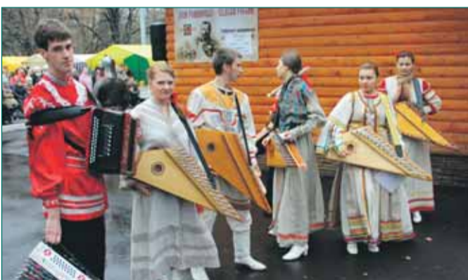
При храме Живоначальной Троицы в Старых Черемушках создан комплекс развивающих и спортивных студий для детей, молодежи и даже родителей.

«Жена на «пятерку» – новый православный проект для мам. Сама идея создать систему обмена опытом для мам родилась в среде молодых родителей, которые постоянно спрашивают друг у друга совета. Родители, как правило, собираются вместе с детьми по выходным в одном из самых красивых мест Академического района – возле храма Живоначальной Троицы в Старых Черемушках. И конечно, родители задают друг другу много вопросов по воспитанию детей, о том, как сохранить семью, любовь и мир, как создать нормальный климат дома.