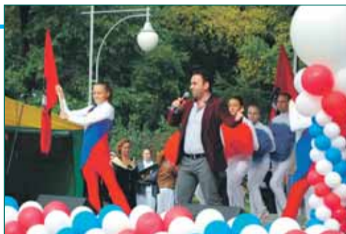
Праздники во дворах

Спортивно-развлекательная программа Открытие спортплощадки, концерт, выступление черлидеров, волейбольный турнир спортплощадка ул.Б.Черемушкинская, д.18