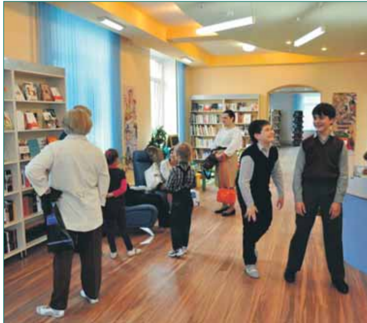
В День города Москвы – 6 сентября – на площади Хо Ши Мина у метро Академическая «Есенинка» организует праздничную программу «Я люблю этот город вязевый». В программе: конкурсы, викторины, вручение призов, запись новых читателей, книги в дар нашим москвичам и гостям столицы.

Библиотека-филиал №173 им. С.А.Есенина – одна из старейших библиотек в Москве, основана в 1955 году. Имя Есенина было присвоено ей в 1971 году. В 1994 году в библиотеке был открыт первый в Москве музей Сергея Есенина, объединивший есениноведов Москвы, Санкт-Петербурга, Рязани, ближнего и дальнего зарубежья.