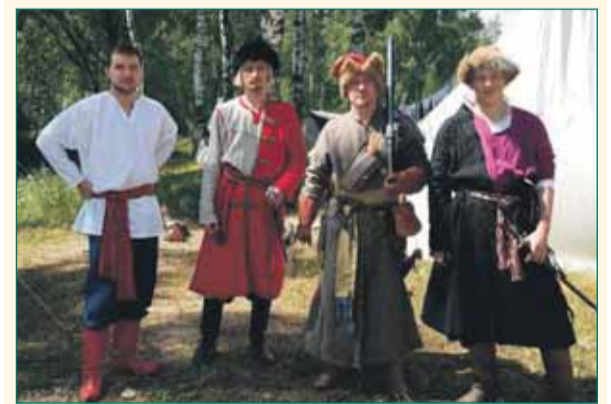
Молодежь храма Живоначальной Троицы в Старых Черемушках в составе клуба исторической реконструкции и фехтования «Засечная черта» приняла участие в военно-историческом фестивале «Битва при Молодях».

Целью фестиваля была реконструкция знаменитой Молодинской битвы. Битва при Молодях – это крупное сражение, произошедшее между 29 июля и 2 августа 1572 года в 50 верстах южнее Москвы, в котором сошлись в бою русские войска под предводительством князей Михаила Воротынского и Дмитрия Хворостинина и армия крымского хана Девлета I Гирея, включавшая, помимо собственно крымских войск, турецкие и ногайские отряды. Несмотря на значительное численное превосходство, крымско-турецкая армия была обращена в бегство и почти полностью перебита.