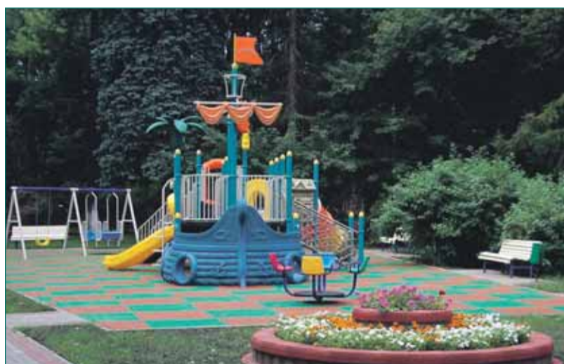
пр-т 60-летия Октября, д.25-27