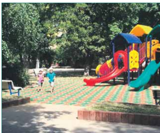
ул.Шверника, д.2 корп.2