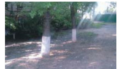
В результате принятых мер

– Рядом с домом 15 на проспекте 60-летия Октября отсутствуют секции ограждения, защищающие зеленые насаждения, и забор. Из-за этого там стали парковаться автомобили, которые уничтожили газон. Трава перестала удерживать землю, из-за чего после дождя на расположенный рядом тротуар льются потоки грязи. Прошу рассмотреть возможность установки в этом месте скамеек или малых архитектурных форм. Эта мера позволит гарантированно предотвратить незаконную парковку автотранспорта и будет способствовать отдыху жителей.