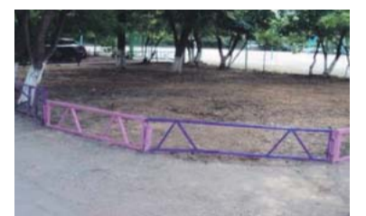
В результате принятых мер

– На спортивной площадке между домами 9 и 11/11 по улице Профсоюзной частично сломано одно из баскетбольных колец (отломился один из усов, поддерживающих кольцо). Прошу приварить его обратно.